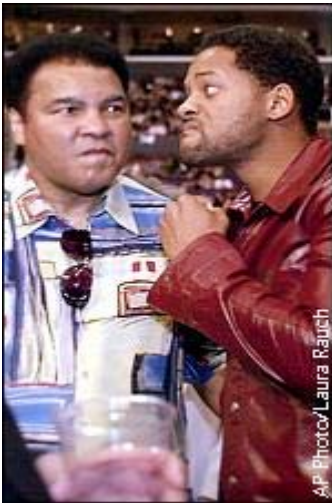
Ali zusammen mit Will Smith der, die Hauptrolle spielte im Film "Ali"