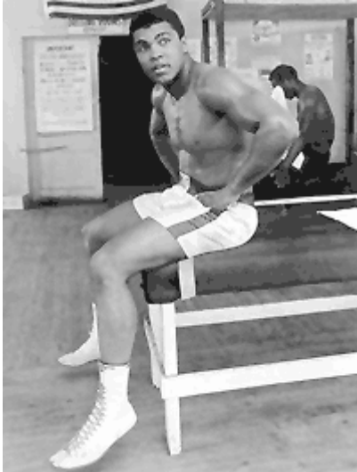
Ali vor einem Kampf